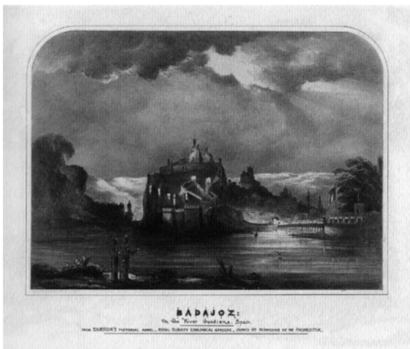
Grabado del Illustrated London News de la recreación del Sitio de Badajoz en el Surrey Zoological Gardens, 1849.

diez veces en el transcurso del combate y, pese a ello, arrogarse la heroicidad de la noche izando la bandera británica en lo alto de una torre del castillo. Aunque, según el mismo y dado que el espectador pagaba tan sólo un chelín por el espectáculo, no cabía exigir otro menesteroso resultado, razón por la cual recomendaba la función a los incondicionales de la austeridad, a los que sin duda les resultaría muy grata 17 .