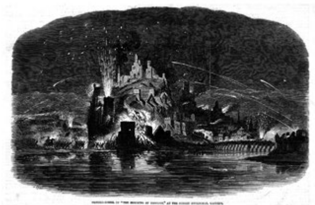
Grabado del folleto explicativo de la recreación del Sitio de Badajoz que tuvo lugar en el Surrey Zoological Gardens en 1849, respectivamente.

Más por lo menudo, The Puppet-Show dedicaba varios párrafos a censurar la infeliz velada que había tenido lugar la noche del 4 de junio en el Surrey Zoological Gardens, donde: