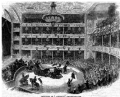
Grabado contemporáneo. Exhibición del Astley's Amphitheatre.

El uso de la escenografía se antojaba crucial para conseguir este resultado, por lo que el patrón geográfico se adaptó fielmente en la secuencia de los actos representados. Finalmente, la progresión de los épicos y laureados combates narrados conforme con una fidedigna línea temporal, era abruptamente interrumpida ante el Sitio de Badajoz en junio de 1811, pero la obra cumplía el objetivo de ilustrar al espectador completando la información que, sobre las operaciones militares del Ejército británico, tenía cumplidamente a su disposición a través de los diarios.