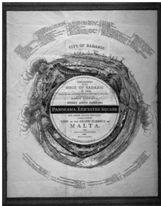
Portada original del folleto explicativo del Panorama Badajoz.