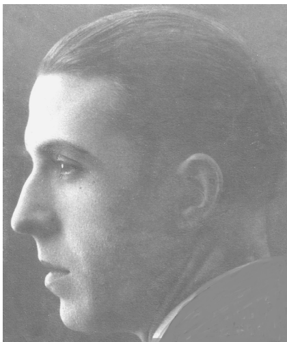
Lám. 2. Retrato fotográfico de Alfonso Trajano.

siguieron después otros varios, tienen finas transparencias de esmalte y virtuosismos de miniaturistas. <<Perdidas en el bosque>> y >Hacia el castillo de las aventuras>> parecen ilustraciones de cuentos de hada".