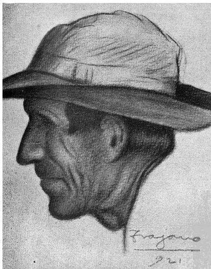
Lám. 3. Dibujo de Trajano publicado en La Esfera . 25-10-1924.

decorativa y su componente satírico, especialmente expresado en La cola , El crimen de Cuenca y Día de huelga .