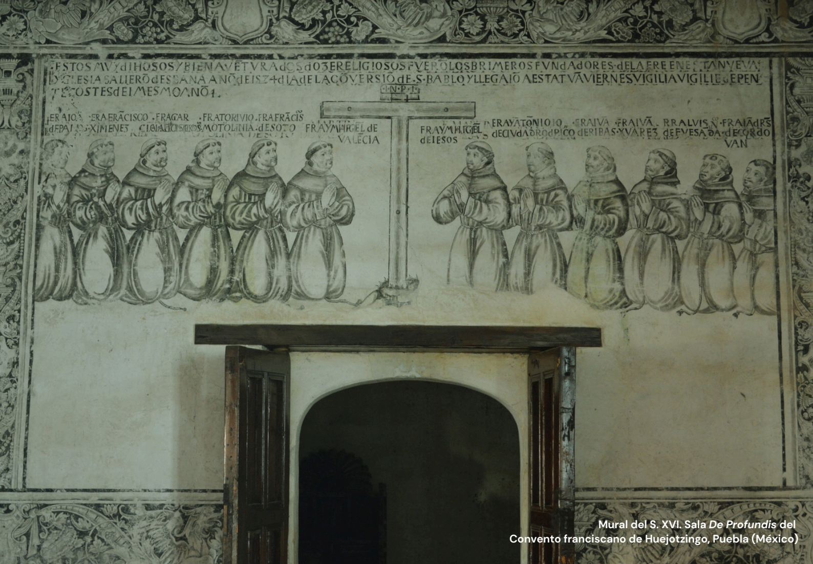
Mural del S. XVI. Sala De Profundis del Convento franciscano de Huejotzingo, Puebla (México)