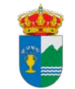
AYUNTAMIENTO DE GUADALUPE