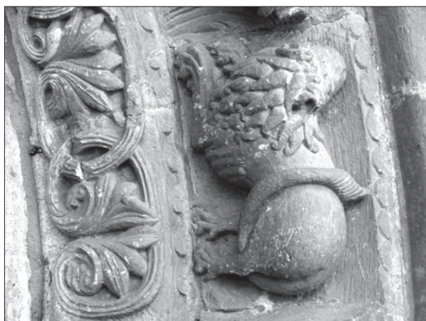
Lámina 2. Leones de Santa María la Real de Piasca.

En algunos casos especiales, tal como el que se da en la fachada meridional de la catedral de Orense, la alegoría judicial la proporciona directamente la imagen de Salomón. Allí el rey