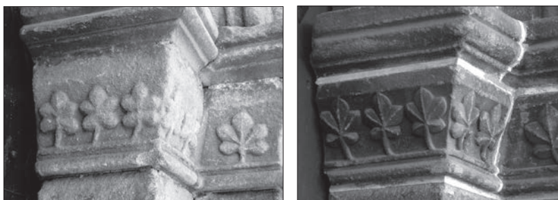
Lámina 4. Izquierda capitel del Salvador, derecha capitel de S. Esteban.

En los sencillos pórticos de las pequeñas iglesias parroquiales que se levantan en una ciudad nueva, en la cual, todavía, no ha habido tiempo suficiente para que se de la aparición de grupos sociales que puedan demandar una mayor significación en sus templos urbanos, la ilustración de sus portadas será forzosamente sencilla. En aquellos, cabeza de collación , en cuyos atrios tengan efecto las reuniones vecinales presididas por el alcalde para juzgar los pleitos, el objeto icónico ilustrativo de sus capiteles será el más apropiado evocador simbólico de la función a la que nos referimos, el mismo en todos ellos, la hiedra.