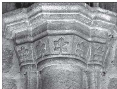
Lámina 6. Claustro de la catedral.

de la otra, la secuencia del proceso tiene en cuenta una serie de pasos que permiten concertar condiciones que alivian las consecuencias de su desarrollo facilitando el progreso del mismo dentro de un cauce gobernado por acuerdos. En el pleito entre clérigos y legos, si alguno de ellos no quisiere el juicio, se podría apelar al juicio del capítulo (§. 316). En el caso de que el lego fuera objeto de querrela por parte del clérigo, ésta debería ser planteada según el orden de la iglesia y si el caso se producía al revés, según el orden del Fuero (§. 319). Ambas partes tenían abiertas las vías de recurso y apelación que considerasen oportunas: en un caso, desde la collación al corral de alcaldes y al mismo Rey; en otro caso, desde el arcipreste correspondiente hasta el cabildo, hasta el obispo y hasta el Papa, (§. 316 a §. 330).