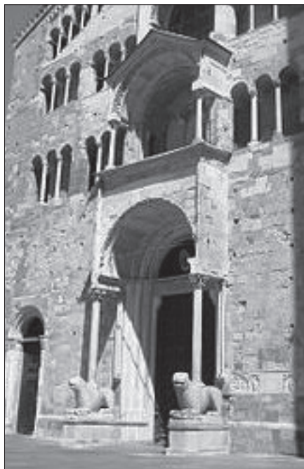
Lámina 1. Protiros de Módena a la izquierda y Parma a la derecha.

En alguna iglesia relevante de ciudades o villas significadas, el pórtico elegido como espacio de utilización procesal jurídica, especialmente en la fase final y resolutoria, adquiría una especial relevancia gracias a su peculiar disposición arquitectónica y a la presencia de dos leones flanqueando la correspondiente puerta. Así, los juicios que allí se celebraban se hacía: “ Inter leo-