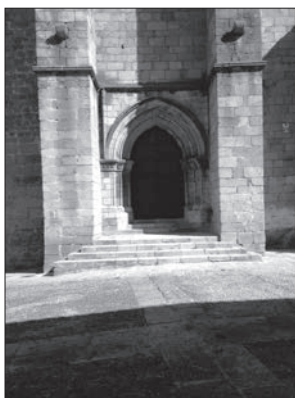
Lámina 3. De izquierda a derecha: Corrales de Salvador, San Esteban, San Nicolás.